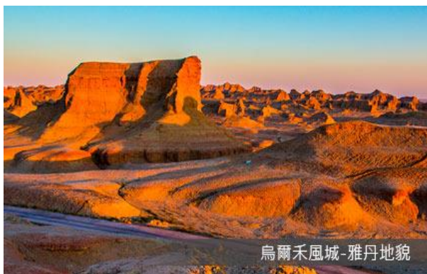
烏爾禾風城-雅丹地貌